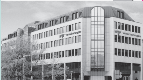
Verwaltungsgebäude Hauptstätter Straße 96-100