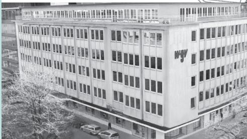
Neues Servicezentrum Feinstraße 1 (mit Tiefgaragenzufahrt)