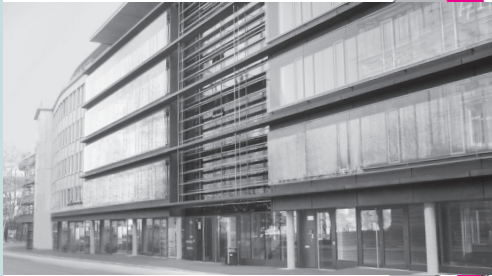
Neues Verwaltungsgebäude Tübinger Straße 55